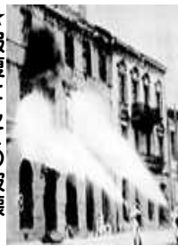
蜂起の結果として破壊された街

一九四四年夏、ソ連軍がドイツイツの街を破り、ワルシャワを占領した。ドイツイツの街は、蜂起の結果として破壊された。蜂起の結果として破壊された。蜂起の結果として破壊された。