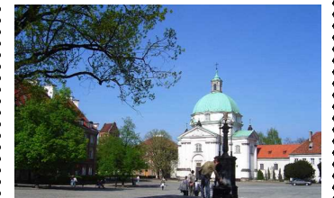
(新市街広場と聖カシミール教会)

13世紀の街並みである旧市街の北には、18世紀の新市街が広がっています。どちらも第二次世界大戦中にドイツ軍によって破壊され、廃墟同然となりましたが、市民の寄付と勤労奉仕によって、往時と寸分違わぬ姿に再建されました。旧市街と新市街の街並みは、ワルシャワ歴史地区として世界遺産に登録されています。